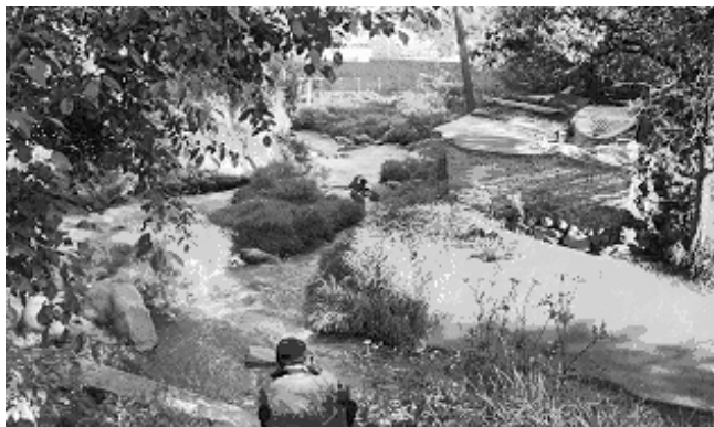
Figura 1. Cauce del Río Magdalena.

En la actualidad, estos ríos y canales se encuentran en un estado deplorable de contaminación pues han servido para evacuar las aguas negras de la ciudad de México. Sin embargo, existe un río que sigue vivo (8) a pesar de haber servido de depósito de descarga de aguas residuales ausentes de sistemas de tratamiento, provenientes de las fábricas textiles; haber servido también como fuente de energía eléctrica y de depósito de lavado de telas de las mismas fábricas; y de haber soportado las actividades derivadas de los asentamientos humanos provocados por una urbanización no planeada en el área, consistentes en desechos de aguas domésticas y basura que se arroja a lo largo de su cauce, desde la parte más alta, hasta el centro de la delegación.